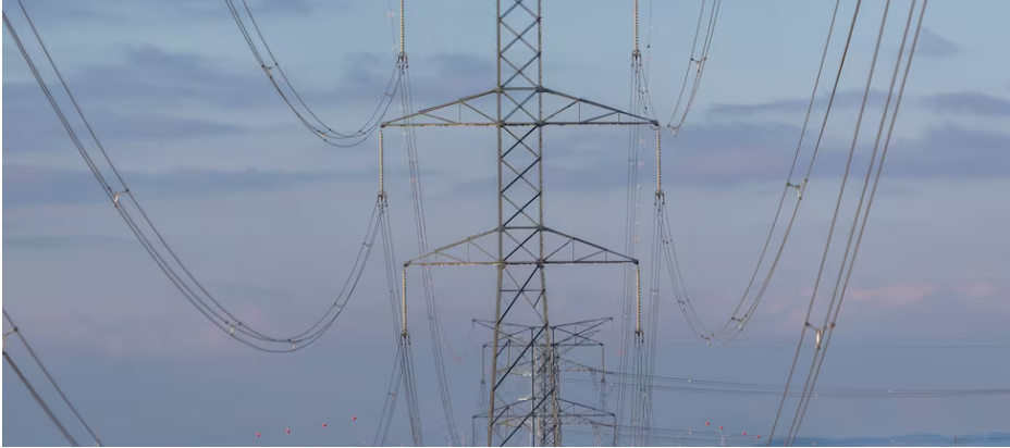
Varias torres eléctricas, en la provincia de Zaragoza a principios de 2023.

La paradoja está servida: los tiempos han querido que, baja ya la marea de la crisis energética, el IVA de la electricidad haya regresado al 21% habitual un mes antes que el del gas natural. En el primer caso, una fuente limpia y llamada a ser el principal vector de la transición verde, la factura de marzo que recibirán familias y empresas estará ya gravada con el tipo de general. En el segundo, una fuente fósil, el regreso al 21% se produce ahora, en abril, ya terminada la temporada de frío.